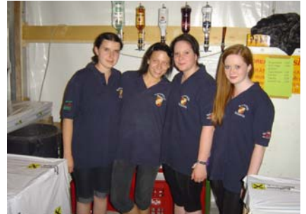
9. Juli Poolparty