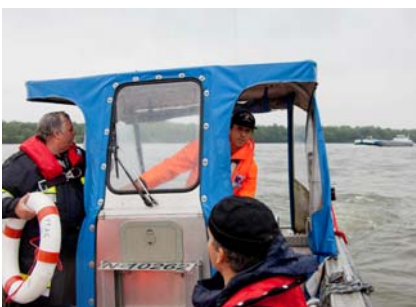
28. Mai SFAB-Fortbildung Altenwörth