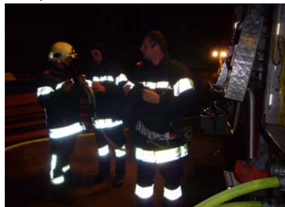
4. November UA-BD-Übung