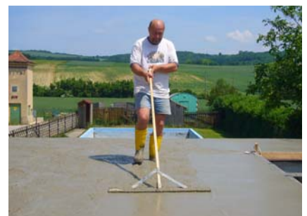
3. Juni Baustelle Nebengebäude