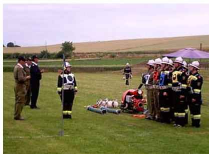
18. Juni Wettkampf Hetzmannsdorf