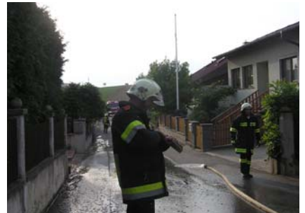
18. September B-Einsatz Großrußbach