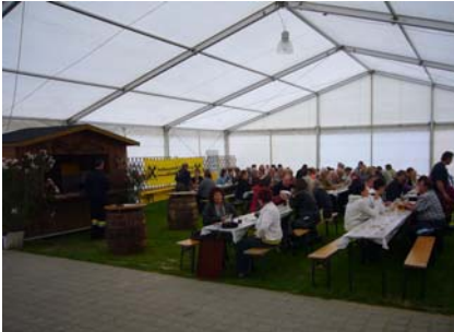
3. Juli Kistensau