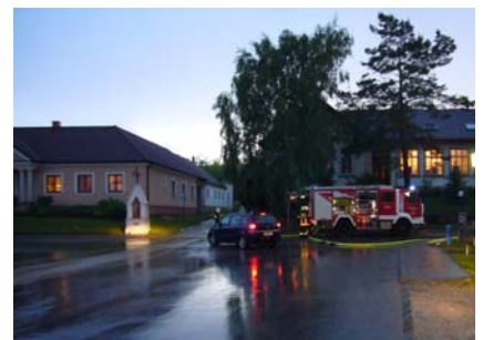
21. Mai Gewitter - Einsatz