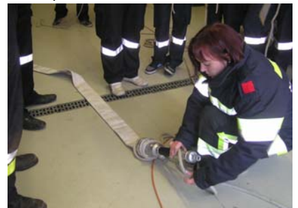
12. November Truppmannausbildung