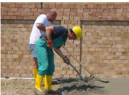
3. Juni Baustelle Nebengebäude