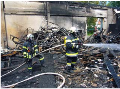
21. Juni Brandeinsatz Langenzersdorf