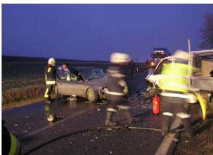
23. November TE Verkehrsunfall