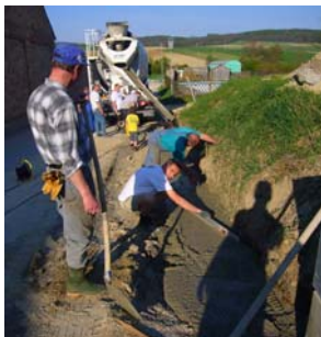
21. April Baustelle