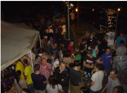
9. Juli Poolparty