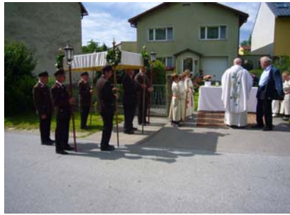
23. Juni Fronleichnam