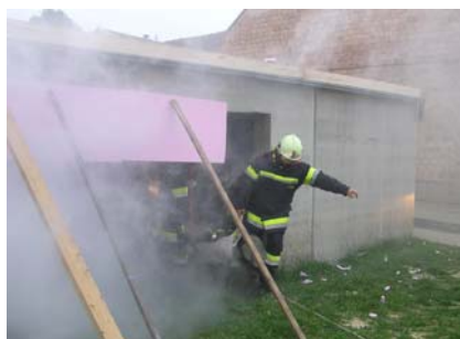
1. Juni BD-Übung