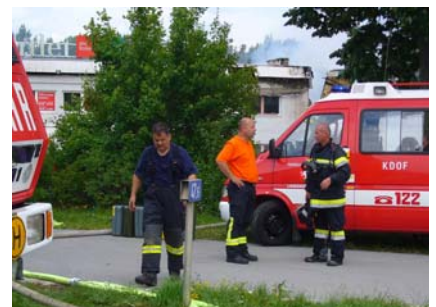
21. Juni Brandeinsatz Langenzersdorf