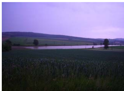
21. Mai Gewitter - Einsatz