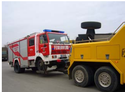
15. Februar Getriebeschaden TLF