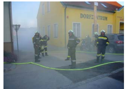
11. Mai Einsatzbrandübung