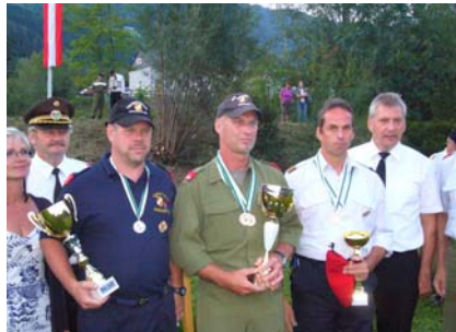
3. September STMK-LWDLB Unzmarkt