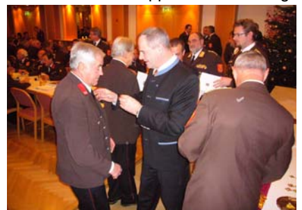
2. Dezember Ehrungen in Leobendorf

Impressum: Jahresrückblick 2011 der Freiwilligen Feuerwehr Weisteig © 2012 Freiwillige Feuerwehr Weisteig Alle Rechte vorbehalten Eigenverlag