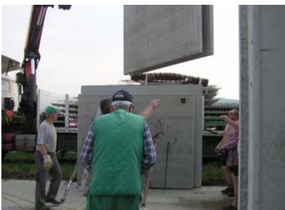
13. Mai Baustelle Nebengebäude