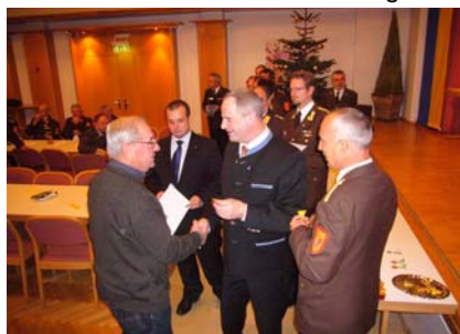
2. Dezember Ehrungen in Leobendorf