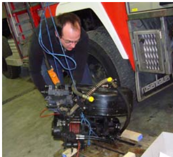
14. Februar Windeneinbau TLF