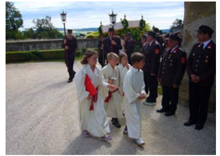
23. Juni Fronleichnam